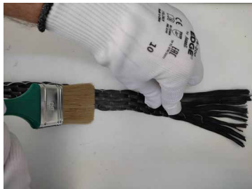
Fase 4: Impregnazione del nastro in situ con resina epossidica EPOFLUID.