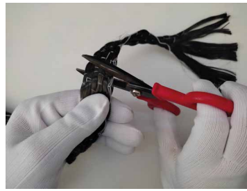
Fase 2: Taglio della trama in polipropilene all'estremità.