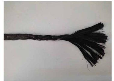
Fase 6: Fiocco completato e pronto per l'inserimento nel foro.

N.B: Al fine di aumentare l'adesione durante le fasi di inghisaggio nel foro si consiglia di spagliare questa porzione, una volta impregnata, con della sabbia di quarzo asciutta tipo EPOQUARZ di Seico Compositi srl in modo da renderla scabra.