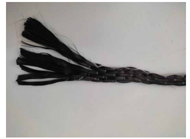
Fase 3: Sfioccatatura d'estremità.