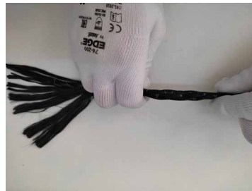
Fase 5: Arrotondamento longitudinale del nastro.