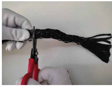
Fase 1: Taglio del fiocco a misura.